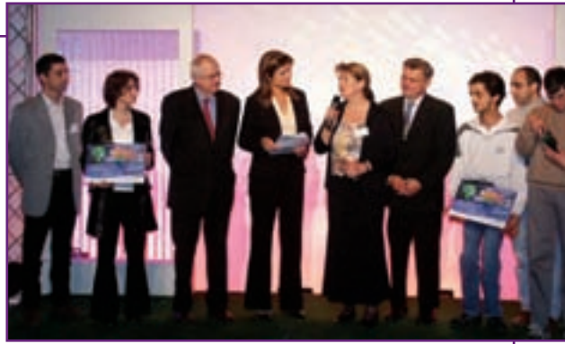
Remise des trophées MIA - Moselle Inter Active - 2005

A l'occasion des Trophées "MIA 2005", organisés par le Conseil Général de la Moselle, le site internet du CCAS de Metz a été nommé meilleur site web de Moselle dans la catégorie "Solidarité".