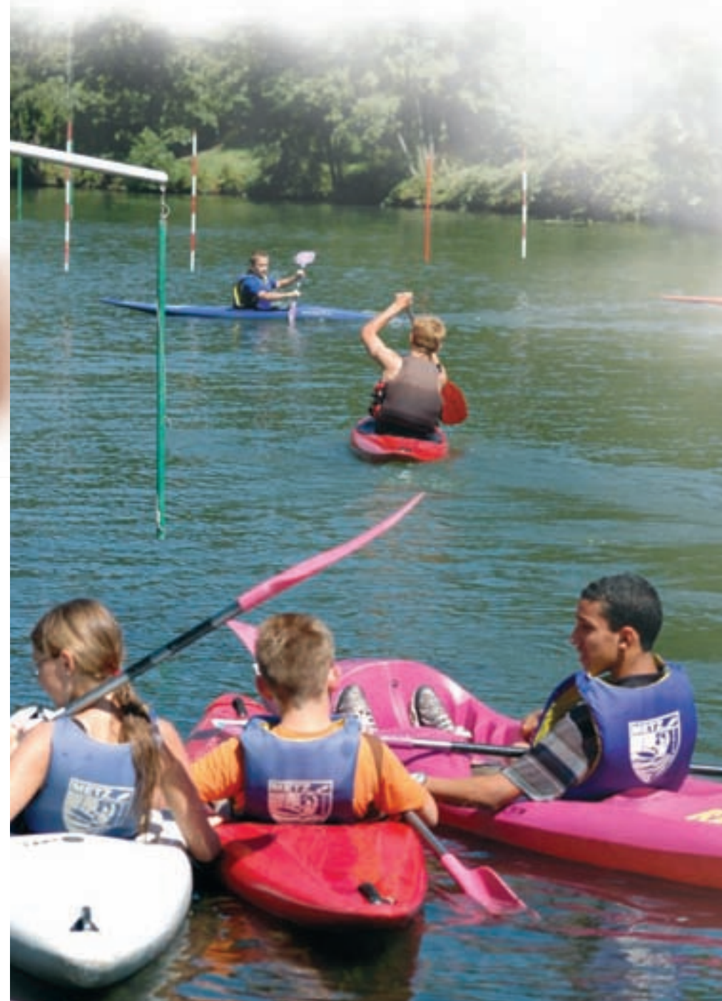
Animation estivale - Kayak

Inscriptions à l'Hôtel de Ville et dans les mairies de quartier.