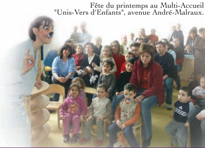
Fête du printemps au Multi-Accueil "Unis-Vers d'Enfants", avenue André-Malraux.

A l'occasion des Trophées "MIA 2005", organisés par le Conseil Général de la Moselle, le site internet du CCAS de Metz a été nommé meilleur site web de Moselle dans la catégorie "Solidarité".