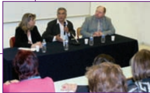
Conférence sur la grande exclusion de Xavier Emmanuelli, Ancien Ministre, Président du Samu Social, à l'Université de Metz.