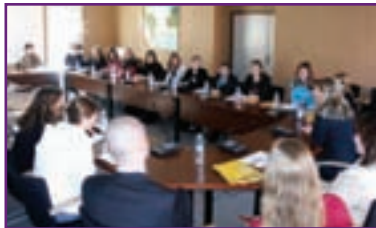
Visite au siège social du CCAS d'une classe de Seconde SMS (Sciences Médico-sociales) du Lycée Georges de la Tour.