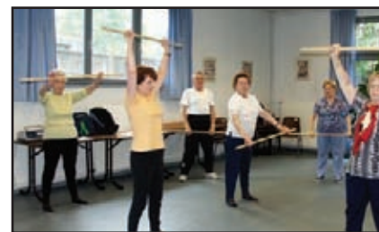
Séance de gym douce au Club de Queuleu-Tivoli

« Elle est basée sur des jeux, parfois avec des accessoires comme des cerceaux ou des ballons. La monitrice imagine des activités différentes chaque semaine qui font aussi bien travailler la mémoire que