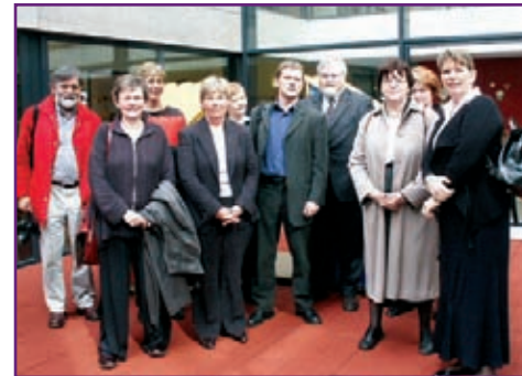
La Ville de Strasbourg en visite dans les équipements de la Petite Enfance à Metz