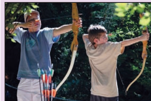
Animation estivale - tir à l'arc

4 rue Coislin - Metz Tél. : 03 87 75 37 65